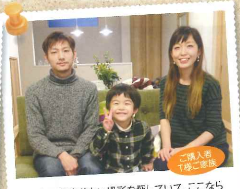
ご購入者 T様ご家族

私達家族が購入を決めたポイントは「建売にはない自由度の高さ」です。建物の色や仕様だけでなく細かな要望や質問にも対応して頂けました。また、周辺は小学校も身近で通いやすく、同世代の家族が多く、同じ年頃の子供も多くて安心しました。