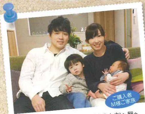
ご購入者 M様ご家族

注文建築(自由設計)ならではの自由度と、駅へのアクセス、また周辺施設を含めた子育て環境の良さが決めてになりました。担当者の方も、私達の今のライフスタイルに合わせて適切に対応頂き、予算や間取りなど、納得して打ち合わせを進めていく事が出来ました。