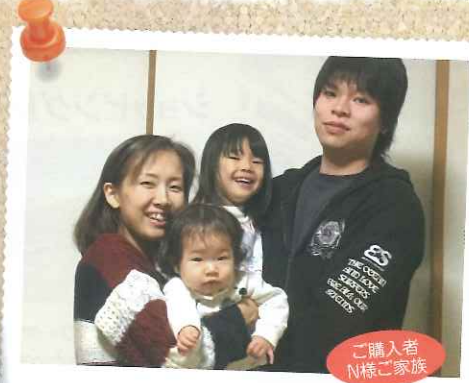
ご購入者 N様ご家族

注文建築(自由設計)ならではの自由度と、駅へのアクセス、また周辺施設を含めた子育て環境の良さが決めてになりました。担当者の方も、私達の今のライフスタイルに合わせて適切に対応頂き、予算や間取りなど、納得して打ち合わせを進めていく事が出来ました。